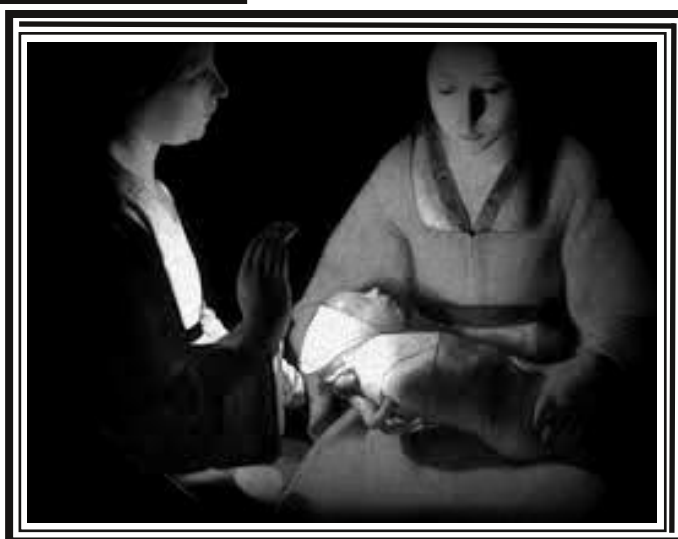
Nouveau Né Georges de la Tour