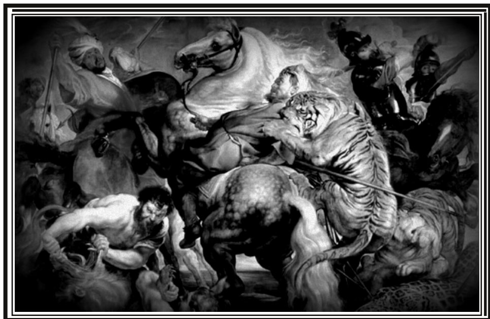
La chasse au tigre